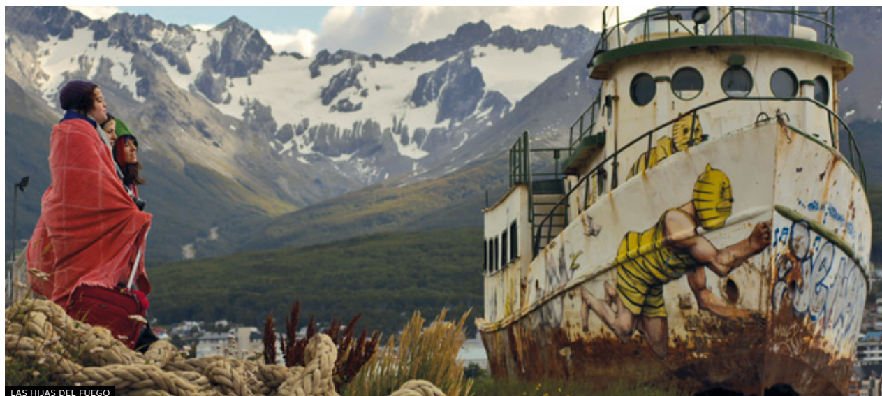
LAS HIJAS DEL FUEGO

Un documentario sulla vita dell'epistemologa e saggista argentina Esther Díaz e del suo lavoro filosofico, legato ai parametri della sessualità e del piacere che dominano la cultura patriarcale e alla possibilità di sovvertire frammenti delle sue attività quotidiane, dai suoi rituali