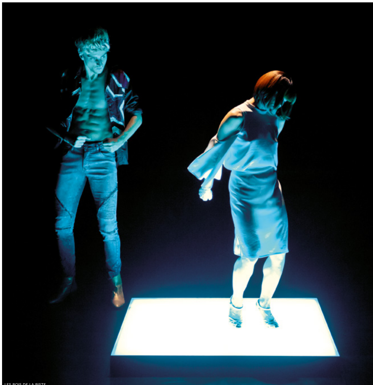
LES ROIS DE LA PISTE