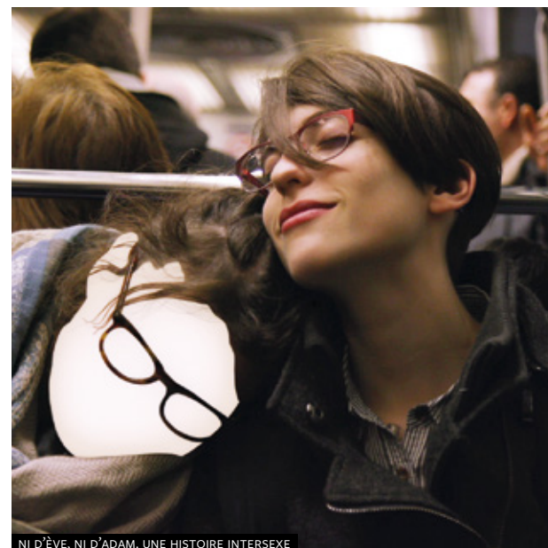
NI D'ÈVE, NI D'ADAM. UNE HISTOIRE INTERSEXE

Quando la drag queen ottantenne Jackie Collins (Derren Nesbitt), a cui è stato diagnosticato un tumore in fase terminale, conosce la giovane collega Faith (Jordan Stephens), decide di prenderla sotto la sua ala. Ne nasce un'amicizia inaspettata, che le aiuterà a conoscere se stesse e ad affrontare paure e dilemmi esistenziali. Un dramma