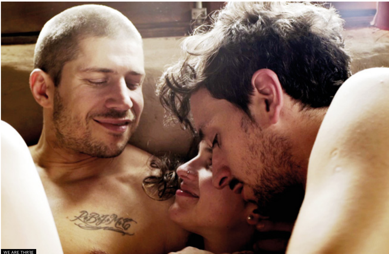
WE ARE THR3E