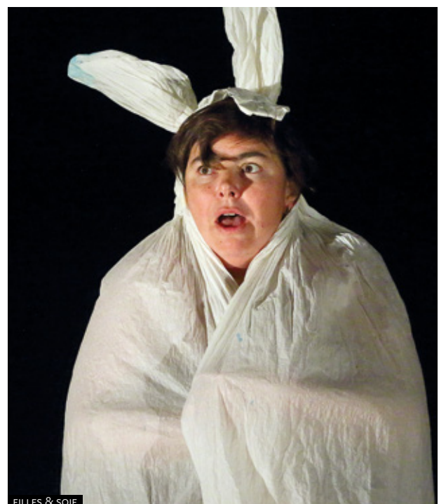
FILLES & SOIE

Alex (Claire Danes) e Greg (Jim Parsons) hanno un figlio di quattro anni, Jake, che ai giochi con le macchinine preferisce le favole con le principesse. Quando la direttrice della scuola materna spiega loro che potrebbero trattarsi di qualcosa di più di una semplice “fase”, Alex e Greg entrano in crisi e sono costretti a mettere in discussione il loro ruolo di genitori e il loro stesso rapporto. Presentato in anteprima al Sundance Festival. Alex and Greg's four-year-old son, Jake, prefers fairy tales and princesses to playing with toy cars. When the director of his nursery school tells them that this could be more than just a phase, Alex and Greg's relationship reaches crisis point.