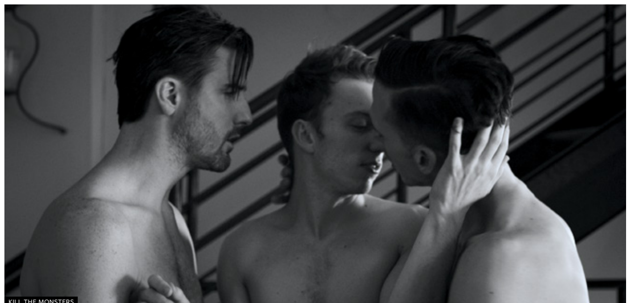
KILL THE MONSTERS

C'è chi dice la definisce DIVINA, ma per altri è solo una Material Girl assetata di fama. C'è chi la trova rivoluzionaria, e chi la accusa di essere una spregiudicata catalizzatrice di nuovi trend. E infine c'è chi la adora per essere una divina material girl rivoluzionaria che sa il fatto suo e anche di più, vale a dire una real bi**h. Fan e hater, unitevi per celebrare l'unica, stra-discussa e stra-viziata regina del pop. For some she is divine, for others she is just a material girl with a thirst for fame. Those who find her revolutionary, others accuse her of being a ruthless catalyst of new trends. Tonight we celebrate the unique and extravagant queen of pop.