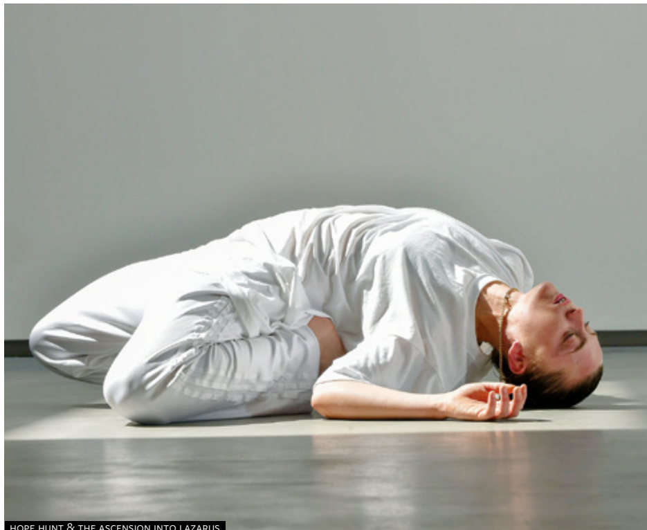
HOPE HUNT & THE ASCENSION INTO LAZARUS

Mostra fotografica e audiovisiva di Gioia Maini INGRESSO GRATUITO