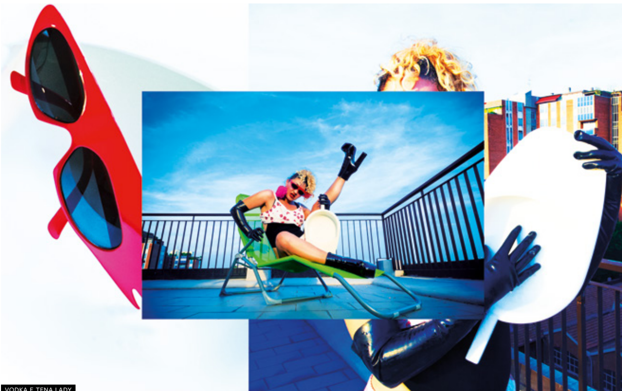
VODKA E TENA LADY

Per la prima volta in traduzione italiana (a cura di Wit, Women in