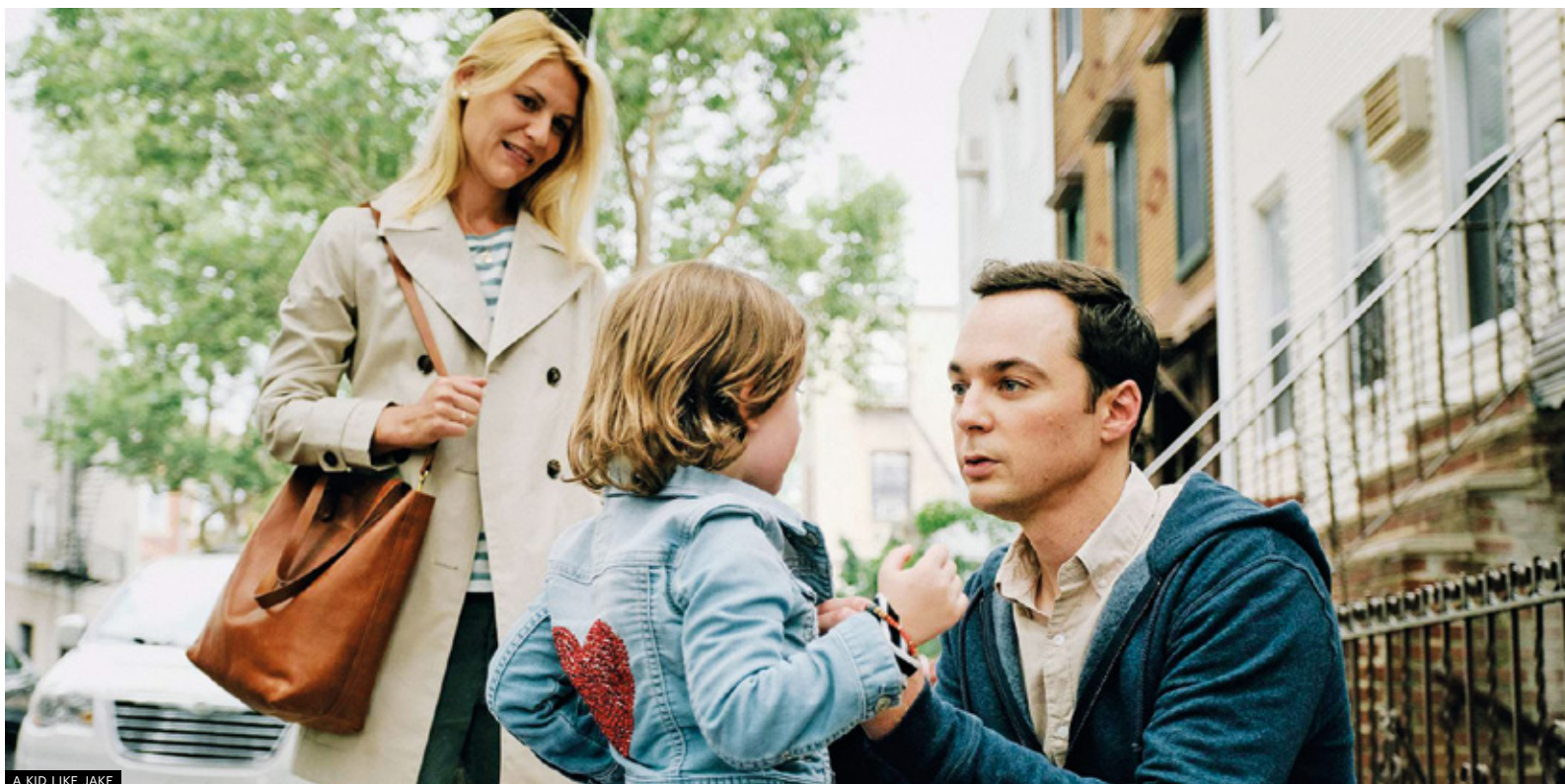
A KID LIKE JAKE