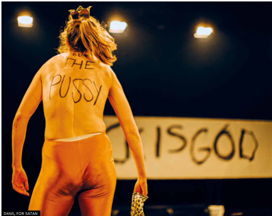
DANS, FOR SATAN