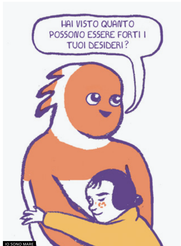
IO SONO MARE

La quindicenne Lara (Victor Polster) sogna di diventare una ballerina classica e finalmente viene ammessa in una scuola di danza. Ma c'è un problema: è nata in un corpo di ragazzo. Il film d'esordio del regista belga Lukas Dhont è stato la