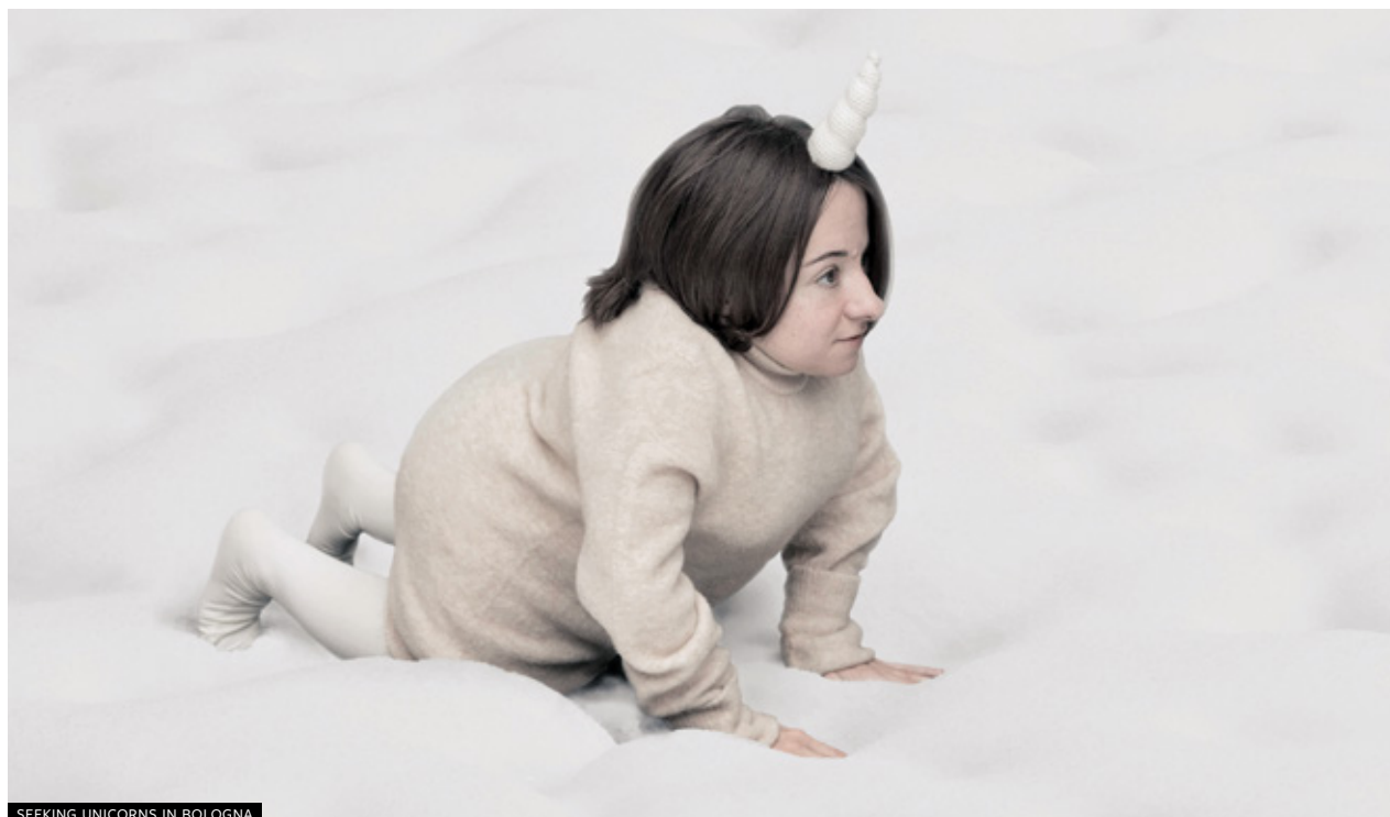
SEEKING UNICORNS IN BOLOGNA

Warriors Foot takes football played by children on the street and contaminates it with dance, in a sort of choreographic battle